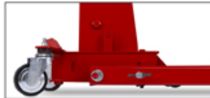
Los modelos FC-5A, FC-10A y NC-10A con patas de 80 mm para uso en espacios de poca altura.