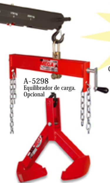
A-5298 Equilibrador de carga. Opcional

Su brazo elevador extensible, las ruedas giratorias y el gancho de seguridad pivotante facilitan el acceso a la carga y su maniobrabilidad.