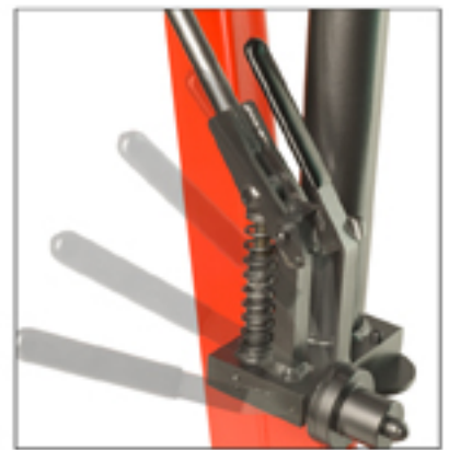
Palanca "Hombre muerto" que permite un control extremadamente preciso del descenso.