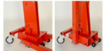
Los modelos FC apenas ocupan espacio, se pliegan muy rápidamente y son muy cómodas de transportar gracias a sus ruedas auxiliares fijas.