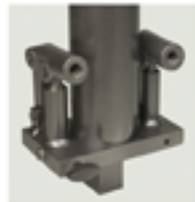
El modelo de 3t, NC-30, está dotado de una doble bomba.